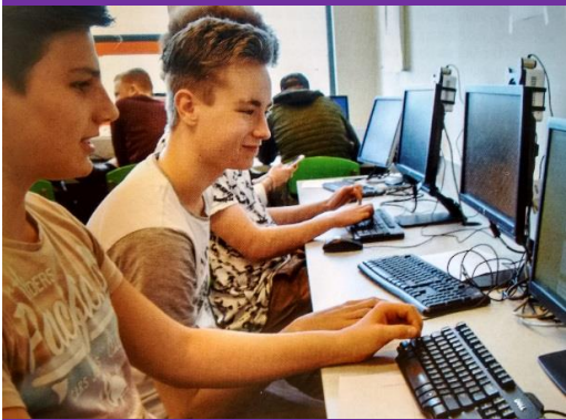
Leerlingen starten met Qompas